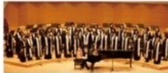
ゲスト：東京女声合唱団